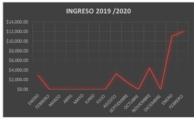
Fig. 1. Ingresos económicos obtenidos en el año 2019 y meses transcurridos de 2020 por parte de las artesanas con venta de productos de palma.

A pesar de estar en constante capacitación para fortalecimiento del proyecto se continuó con los trabajos de producción y cumplimiento de pedidos con clientes consolidados, teniendo un ingreso anual 2019 de $11,950 con una media de ingreso mensual de trabajo de $995, Sin embargo al iniciar 2020 y a tan solo dos meses del mismo se logró un ingreso de $23,000 lo que significó que en tan poco tiempo han incrementado sus ingresos y producción en un 51% en comparación con el año pasado.